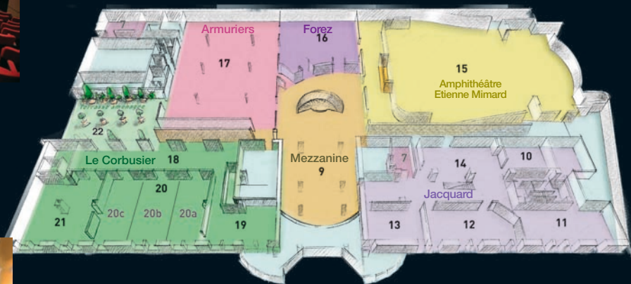
1 er étage